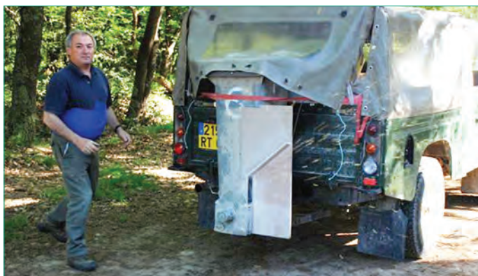
Les communes sur lesquelles les postes d'agrainage fixes sont possibles sont les suivantes :

Toutefois, la voirie forestière n'étant pas présente ou accessible toute l'année dans les Pays 4 et 5, il sera possible de mettre en place, si aucune autre solution alternative n'existe, un réseau de postes d'agrainage fixes, en respectant toutefois les dates définies précédemment.